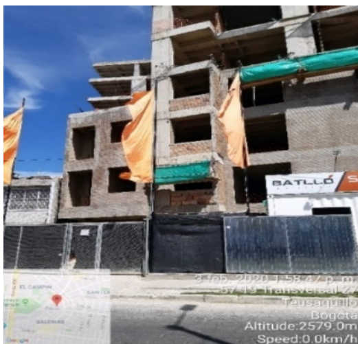
Fotografía 1. Fachada de la obra, sobre la transversal 27