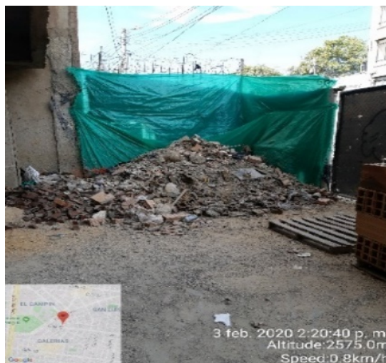
Fotografía 2. Acopio de residuos pétreos para ser dispuestos.

Para dar respuesta a los requerimientos, esta Subdirección otorgó un plazo de ocho (8) días hábiles contados a partir del 4 de febrero de 2020, por lo tanto, mediante el radicado SDA 2020ER39120 la constructora Batlló S.A.S. presentó el alcance a los hallazgos, sin embargo, no efectuó el cargue de la información en el aplicativo web. Por lo tanto, a través del correo escombros@ambientebogota.gov.co solicitó asesoría respecto a la presentación de los certificados de disposición final y aprovechamiento y el manejo del aplicativo web, cuya reunión se llevó a cabo en las instalaciones de la entidad el 24 de febrero de 2020, capacitación impartida por el profesional Esteban Morales.